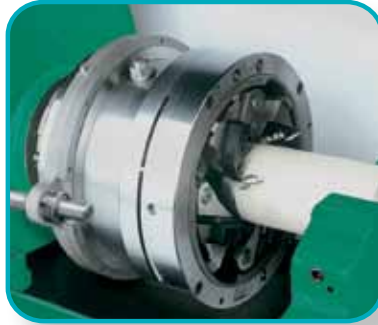
纵向滑架单元，适用于车螺纹及螺纹滚压头。