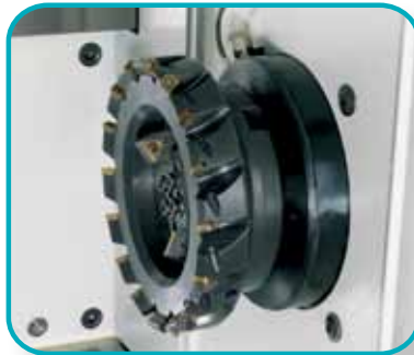
十字形滑架单元，适用于平面铣削和倒棱。