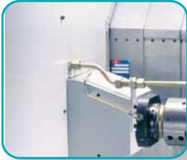
纵向滑架单元带组合刀具头，适用于刨平和倒棱。