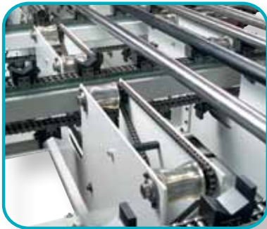
链式节拍带带纵向辊道，用于加工第一面时工件左对齐止动，以及加工第二面时工件右对齐止动。