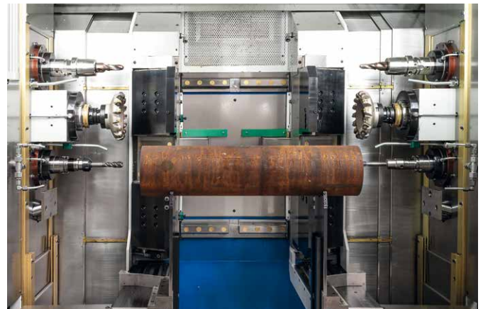
Beidseitige Bearbeitung möglich! Standardmäßig können pro Seite bis zu 3 Werkzeugspindeln angebracht werden.

Unsere Maschinen und Anlagen der Baureihe Enduro V 500 zeichnen sich durch einen konsequent realisierten, modularen Aufbau aus. Basis bildet ein Vertikalbett, an dem die Bearbeitungseinheiten und Spannvorrichtungen im Arbeitsraum hängen. Das gewährleistet die ungehinderte Späneabfuhr direkt auf den darunter liegenden Späneförderer.